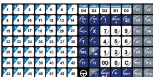
Botonera de 98 teclas