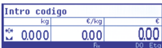
Display gráfico 240x64 puntos