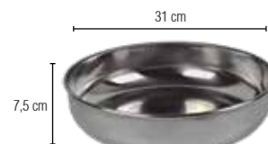
Plato hondo para balanza colgante